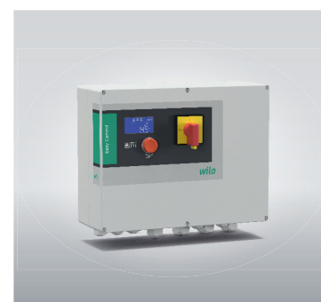
Wilo-Control EC-Lift of DrainControl PL.

Afvalwaterdoppelpomp met snijinrichting. Met ATEX-certificering.