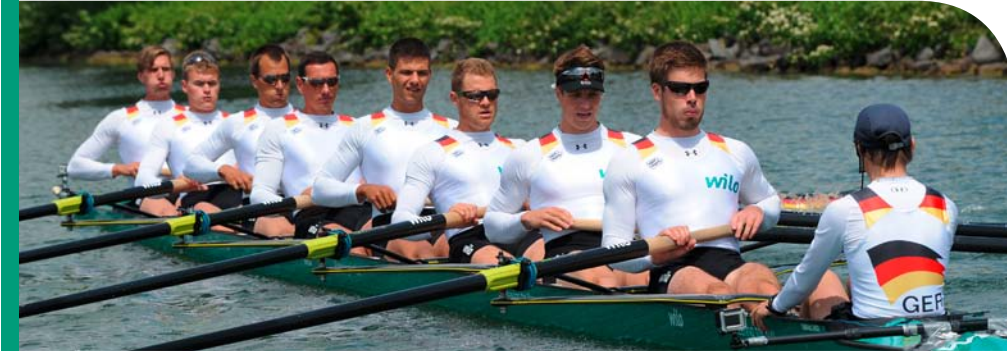
책임감 있고 지속적인 운영을 위한 참고 자료