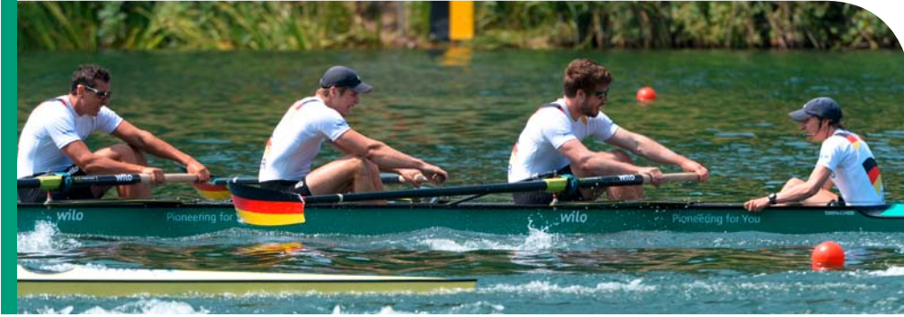
규정 준수 - 시정 조치 이행