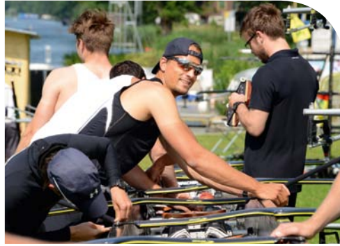
필수적으로 챙겨야 할 직업적 건강 및 안전