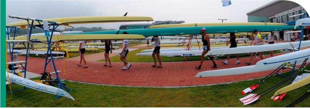
책임감 있게 행동하고 규정을 준수 - 귀사와 귀사의 하도 공급업체