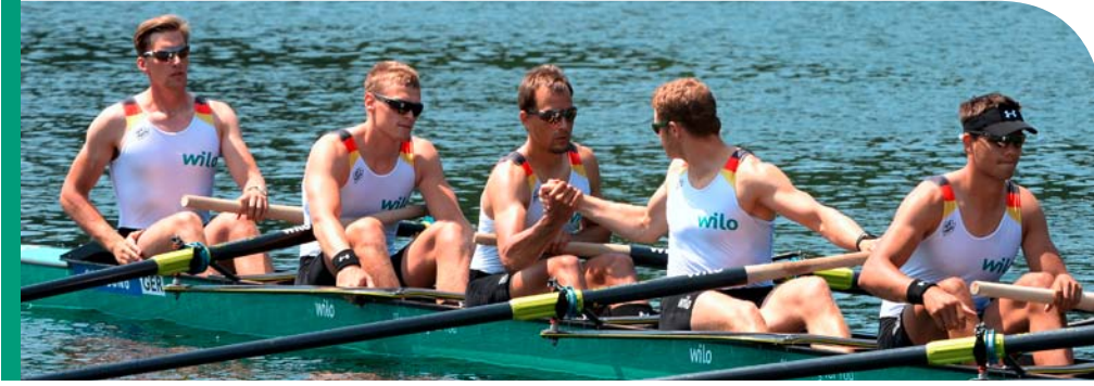
직원을 존중하고 존엄한 마음으로 대우