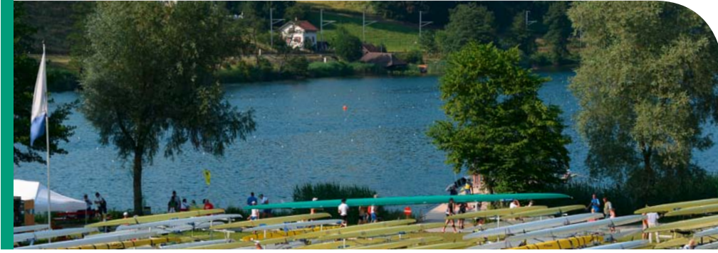
비즈니스를 수행하는 동시에 환경 보호