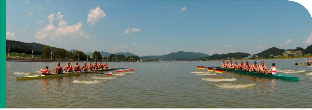
진실성, 존중심, 공정성을 기반으로 한 신뢰할 수 있고 생산적인 협력