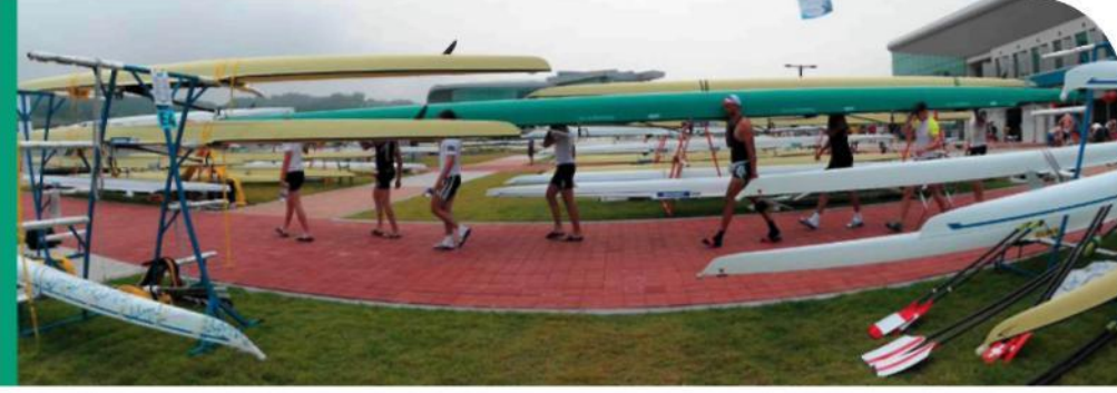
Sorumlu ve uyumlu davranmak – siz ve alt tedarikçileriniz