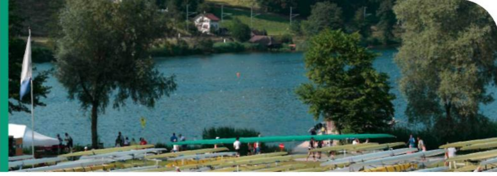
Faaliyetlerimizi sürdürürken çevrenin korunması