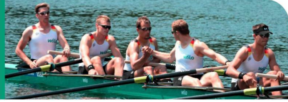
Çalışanlara saygılı ve insan onuruna yakışır davranmak