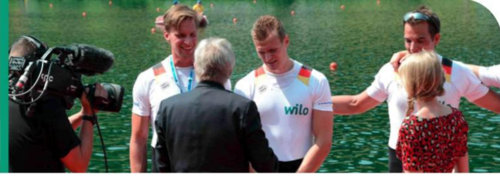
Şeffaflığın inşası – öz değerlendirmelerden denetimlere