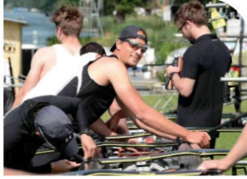
İş sağlığı ve güvenliği, işin gereği