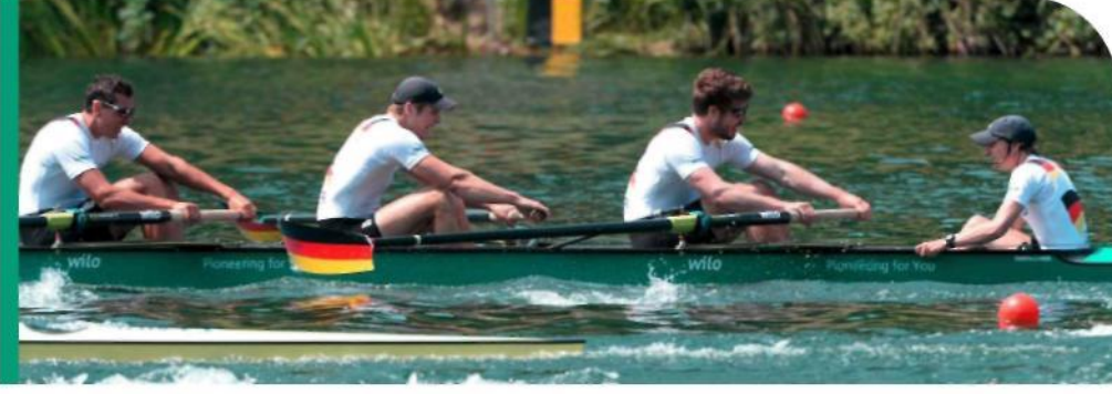
Uyumluluğun başarılması – düzeltici faaliyetler başlatmak