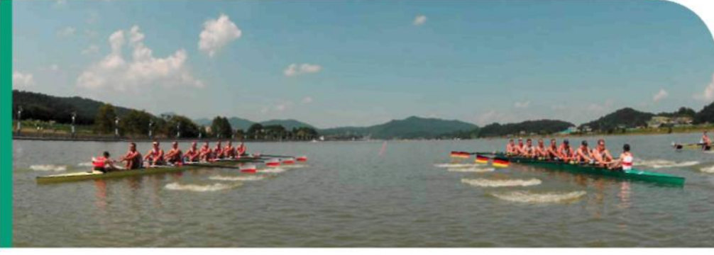
Doğruluk, saygı ve adalete dayanan güvenilir ve verimli işbirliği