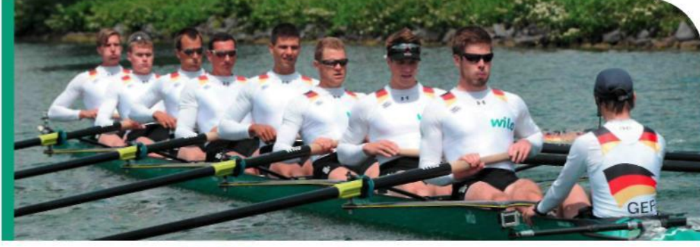
Sorumlu ve sürdürülebilir operasyon için referansınız