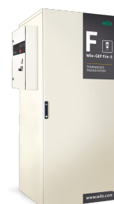
Trinkwasser-Trennstation von WILO IndustrieSysteme

Bei WILO IndustrieSysteme wird diese Herausforderung durch eine Umluftkühlanlage gelöst, die die notwendige Kühlleistung durch das sichere Löschwasser realisiert. Stellt sich z. B. durch Betrieb der Löschwasseranlage eine kritische Raumtemperatur im Aufstellungsraum ein, öffnet eine Zusatzarmatur ② und die automatische Umluftkühlung wird zugeschaltet. Das als Kühlmedium verwendete Betriebswasser wird über einen bauseitigen Siphon in das Kanalnetz abgeschlagen. Ein wöchentlicher Funktionstest gewährleistet den Betrieb der Umluftkühlung im Einsatzfall.