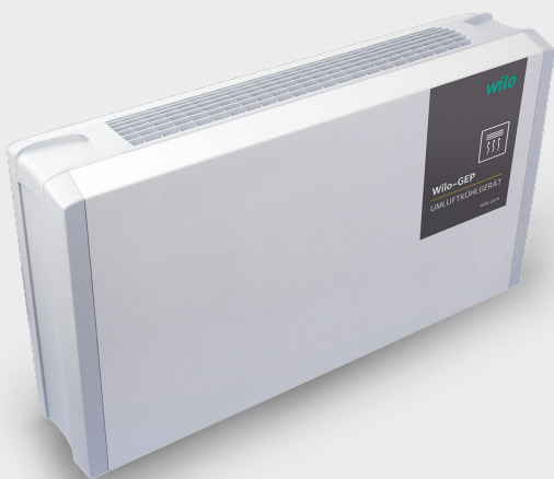
Umluftkühlgerät WILO IndustrieSysteme