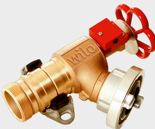
Schlauchanschlussventil optional mit Grenztaster und Anschlussstück