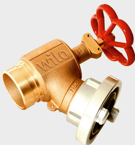
Schlauchanschlussventil WILO IndustrieSysteme